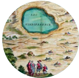
Gravure : la carte du Tendre telle que décrite par Mme de Scudery Clélie, une histoire Romaine (1654-1660)